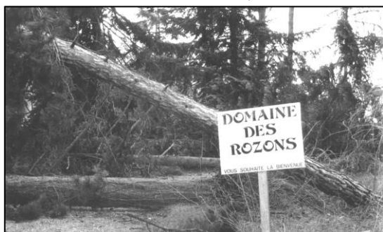
Route des Rozons

Autour du domaine des Rozons.