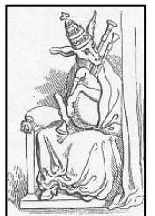
Fête des Anes

Le théâtre profane est un théâtre généralement comique. La farce apparaît au XIII e siècle : c'est une pièce qui présente des situations et des personnages ridicules dans un langage familier voire grossier, c'est un miroir grossissant d'une société brutale, exutoire par le rire des peurs et des colères des gens (carnavals, fête des fous/fête des Anes, caricatures, mimes, charivaris : c'est le théâtre dans la rue)