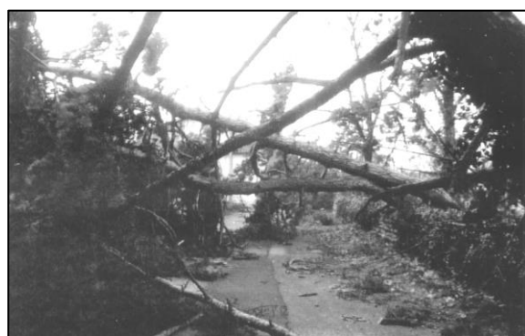
Rue Sainte Marquerite