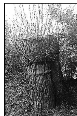
Le mûrier sans ses branches