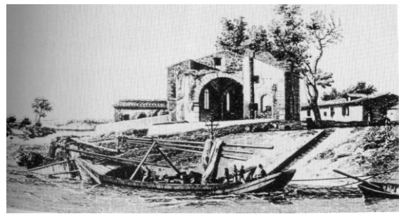
Barque du Rhône en remonte (1817)