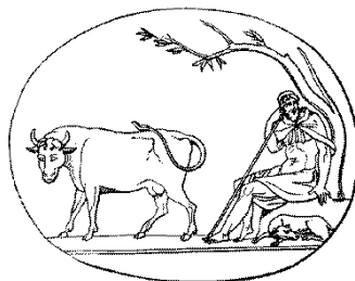
Io et Argus