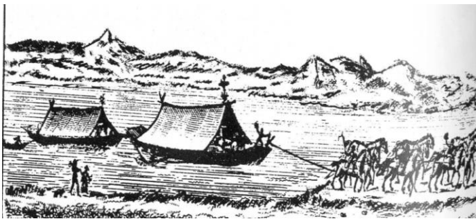
Service régulier du Rhône au Rhin (1830-1840)

Le halage, et plus tard les bateaux à vapeur, permirent des transports de marchandises mais aussi de voyageurs avant l'arrivée de moyens de transport modernes (chemin de fer, autoroute.)