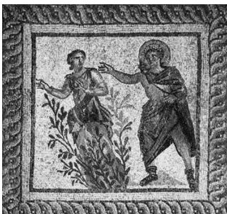
Daphné et Apollon